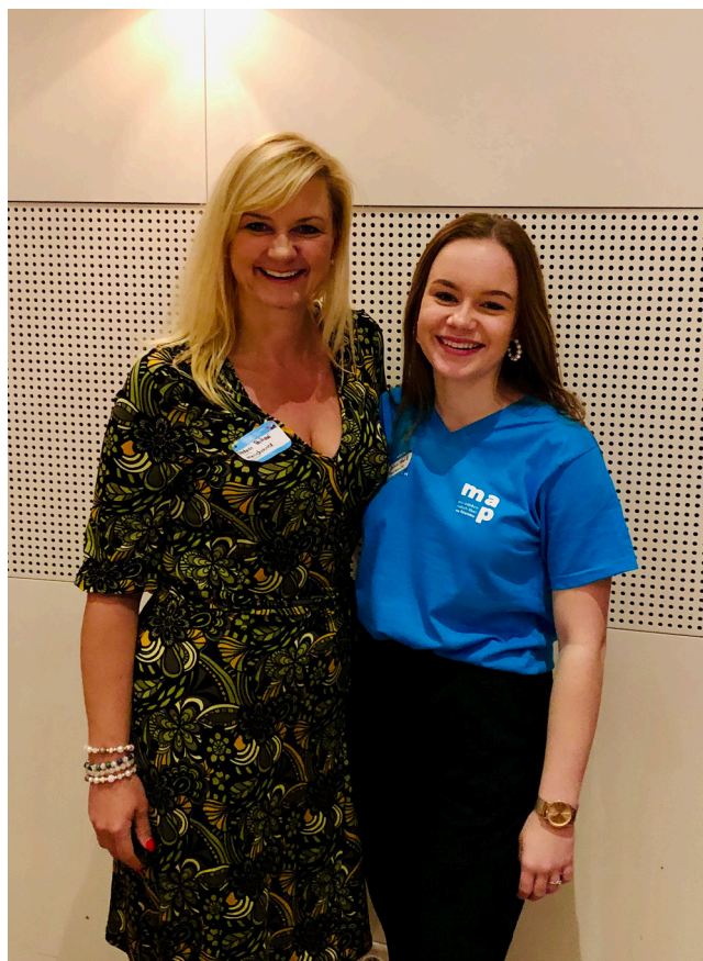
Z konference Společně pro úspěch našich škol na Říčansku

Bude to průšvih. Věřte mi. Začněme konat. Změňme to.