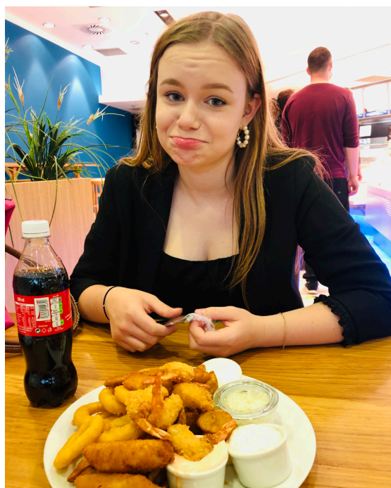
Velký oběd po posledních přijímačkách

Ona měla jasno. Snažila jsem se jí vysvětlit, aby si nechala únikovou variantu a druhou školu zvolila méně „nabitou“. Nechtěla a přijala tu odpovědnost.